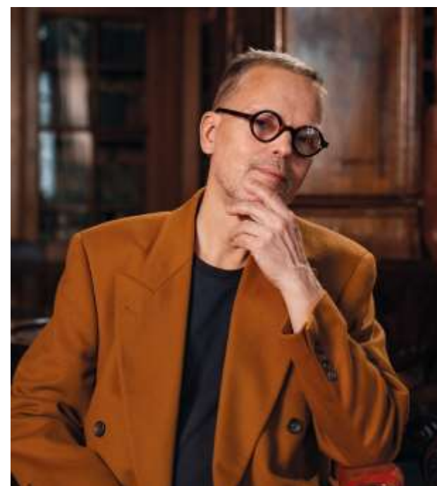
Хокан Хеденмальм, Швеция Санкт-Петербургский государственный университет (Санкт-Петербург)